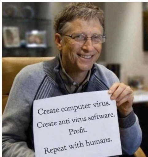
Crea un virus de computadora + Crea un programa antivirus = Ganancias. Repetirlo con humanos.

En 2010, financió un estudio de la vacuna experimental contra la malaria de la empresa Glaxo: 151 bebés africanos fueron matados y 1,048 de los 5,949 niños sufrieron efectos secundarios graves como parálisis, convulsiones y convulsiones febriles ( enlace ).